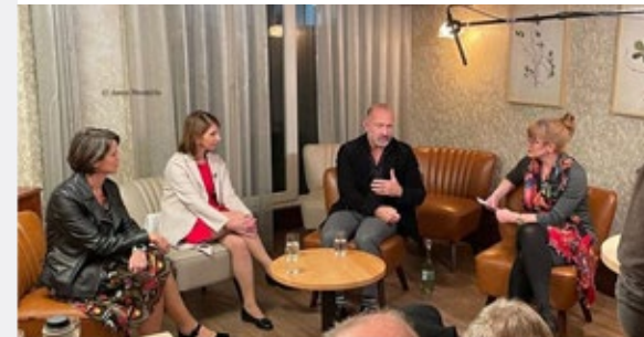
Henkel und Metro werben für Social Plastic