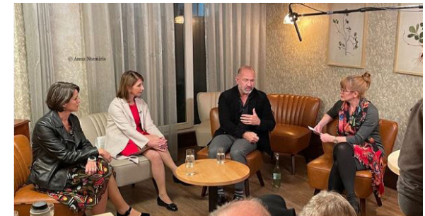
Henkel und Metro werben für Social Plastic